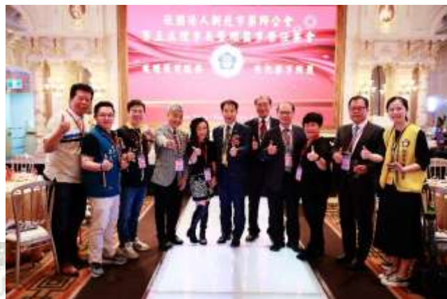
新北市藥師公會第5屆理事長暨理監事榮任餐會 113.4.26