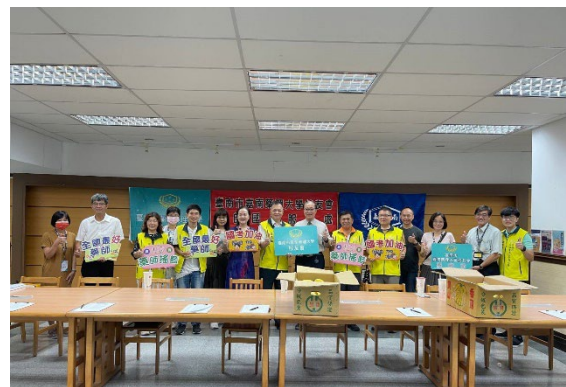
2024/07/20 藥師國考台南市校友會設置考生服務處