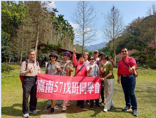
嘉南 57 戊班同學會