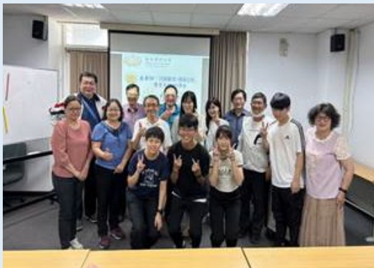
2024/5/25 醫務管理系系友回校舉辦同學會餐會