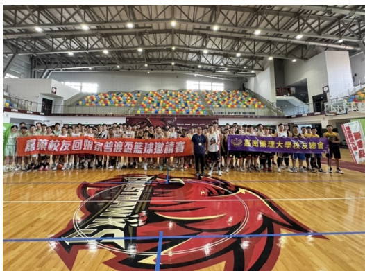
2024/07/13 校友總會校友盃籃球賽