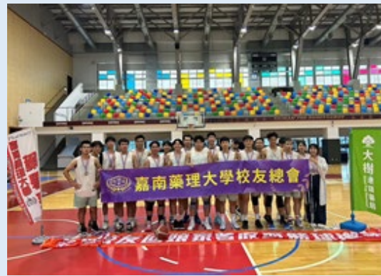
2024/7/13 藥學系系友回校舉辦校友籃球賽