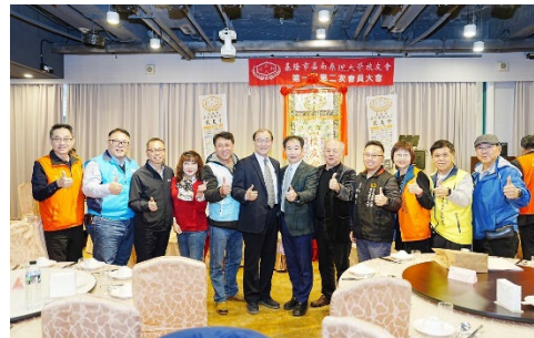
2024/12/22 基隆市嘉南藥理大學校友會第一屆第二次會員大會