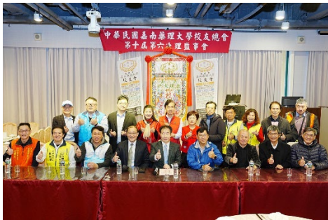
2024/12/22 中華民國嘉南藥理大學校友總會第十屆第六次理監事聯席會議