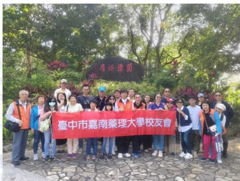
2024/11/24 台中市校友會秋季自強活動