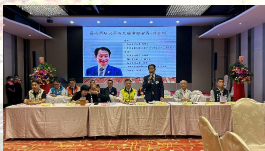
2024/11/03 台南市校友會第三屆第二次會員大會