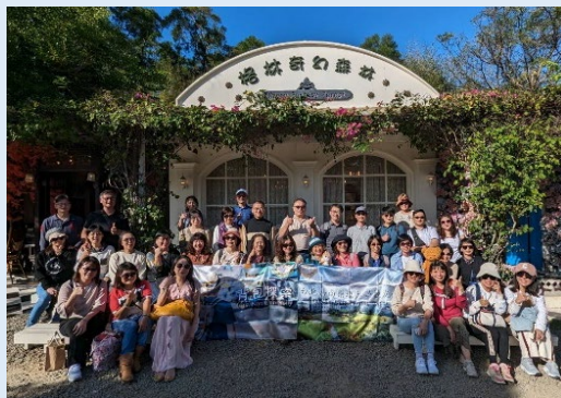
2024/11/24 嘉藥台北市校友會一日遊