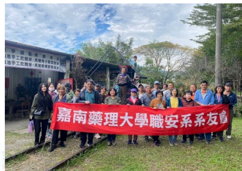
2024/11/24 嘉南藥理大學職安系系友會秋季遊