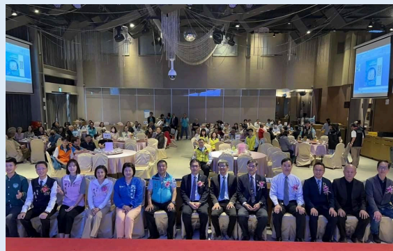
2024/11/24 嘉義市校友會第12屆第二次會員大會