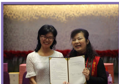
2019.03.17 本校藥學系與台東縣藥師公會簽訂 藥學生社區藥局實習合作協定