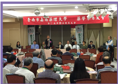
2019.02.17 台南市藥學系系友會 第二屆第二次會員大會