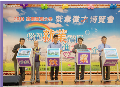
2019.03.27 「搭起就業橋梁，前進幸福企業」 就業徵才博覽會