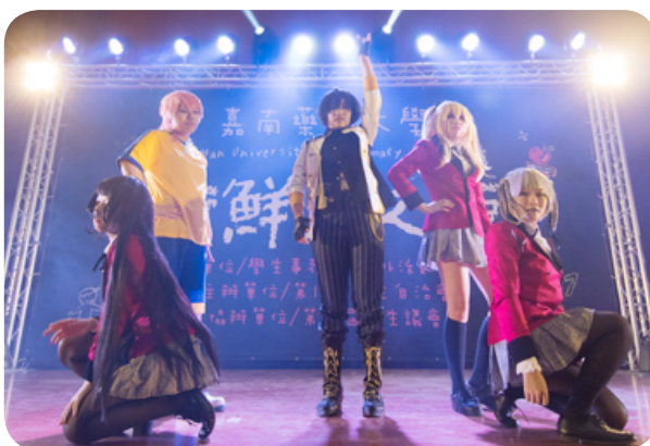
「新鮮人之夜」由社團輪番登場，熱鬧滾滾