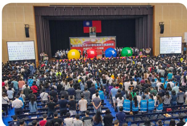
「嘉藥真實」氣球推出，掀起研習活動高潮

為歡迎大一新鮮人，本校於9月15日、16日兩天，舉行別開生面的新生研習活動。學校與學生會安排一連串精采有趣的迎新節目，熱鬧滾滾，包括開訓典禮的贈樹和推球活動、師生角色扮演與新生闖關遊戲，以及新鮮人之夜勁歌熱舞等；校園頓時朝氣蓬勃、生氣盎然，也讓新生感受到青春奔放的活潑校風，留下難忘的大學初體驗。