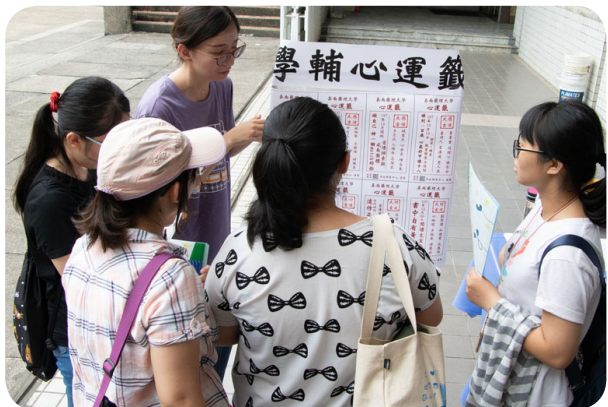
新生研習闖關活動「陪你環遊心世界」

另外，為讓大一新鮮人能及早熟悉校園環境並適應嶄新的大學生活，16日規劃了有別以往的「認識校園闖關活動」，計有「守護燦爛的你-圓夢方程式」、「健康保衛站-戰-讚」、「加入社團-愛上社團」、「守護嘉人-安全幸福」、「陪你環遊心世界」，以及「投打對決」等關卡，藉由闖關方式讓新生儘速瞭解學校各項業務窗口、校園安全宣導重點、生活急難救助、繽紛活力社團、心理情感成長與體育健康休閒等訊息，完成闖關後甚至有好康的摸彩活動，讓新生雀躍不已。