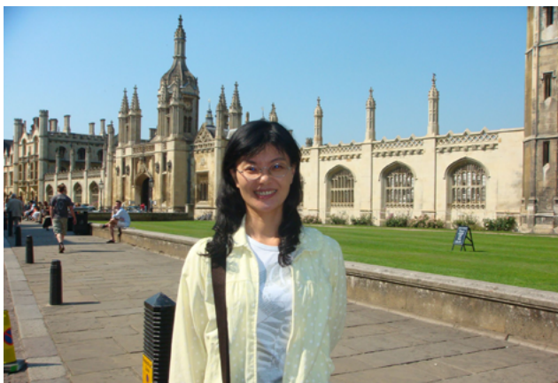
(攝於英國劍橋國王學院)

就在五專畢業後的10年，我又回到母校嘉藥，直到今日歲月匆匆又過了20個年頭。我不是藥學系裡最優秀的畢業生，只是有緣成為現職的系主任，因此有機會與昔日從不認識的校友們重新搭起一座友誼的橋樑。目前我不從事藥師的工作，卻要擔負教育未來藥師之責任，「勿忘初衷」這四個字將引領我在嘉藥未來歲月繼續努力奮鬥！