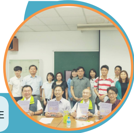
2018.03、04月校友總會 拜會並致謝各學院院長系主任 支持校友日