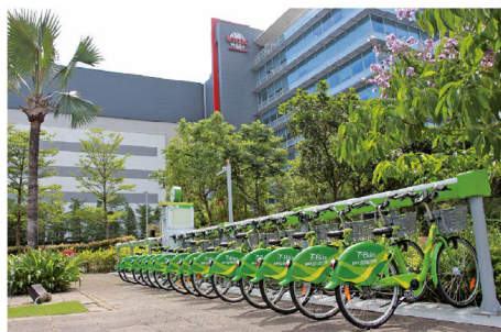
▲台積電捐贈T-Bike租賃站，提供工業區內的民眾藉由騎乘T-Bike來體驗低碳、節能且健身的生活。