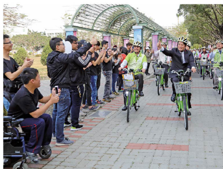
▲嘉南藥理大學捐贈T-Bike租賃站，時任市長賴清德院長於校園內騎乘並歡迎學生們共同響應騎乘。