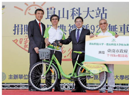
▲9月22日-「世界無車日」，崑山科大捐贈T-Bike租賃站，李孟諺代理市長感謝該校為推廣綠色運輸盡心盡力，落實低碳城市的目標。

至106年11月，T-bike已有53個租賃站，1520輛自行車，會員註冊人數近17萬人次，App下載約8萬次，累計租用次數近70萬，顯示T-Bike逐漸融入市民日常生活。市府以「活力T-Bike、健康常在」為主題，展現具有「品牌化」、「人性化」、「國際化」、「在地化」及「智慧化」等五大特性，搭配大臺南公車的大眾運輸系統，推動低碳輕旅行風氣，獲得行政院衛生福利部國民健康署與臺灣健康城市聯盟的高度肯定，榮獲「第九屆臺灣健康城市暨高齡友善城市獎—健康特色獎」。